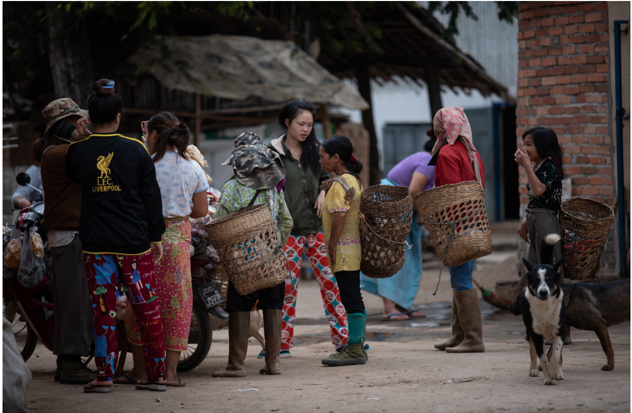
ဝမ်ပုံကျေးရွာ၊ ကျိုင်းတုံမြို့နယ်၊ ဒီဇင်ဘာလ ၂၀၁၉