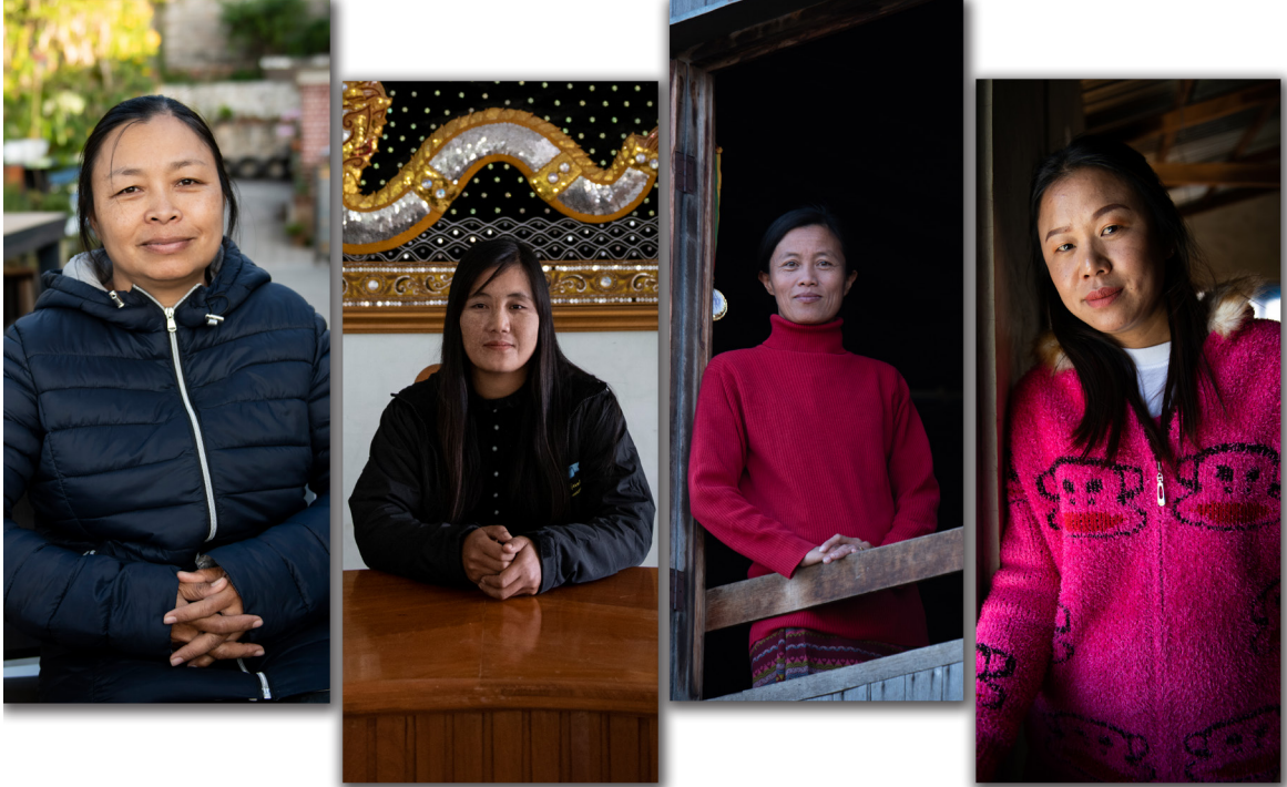
လူထုခေါင်းဆောင်များ၊ ဒီဇင်ဘာလ ၂၀၁၉

MIID ၏ ဒေသဆိုင်ရာ မိတ်ဖက် အရပ်ဘက် လူမှုအဖွဲ့အစည်းများသည် ဤ ကျား မ ဆိုင်ရာ သုတေသနအတွက် အဓိက သုတေသီများ ဖြစ်ကြသည်။ ထို့အပြင် ဤ မိတ်ဖက် အဖွဲ့အစည်း တစ်ခုချင်းစီမှ အမျိုးသမီးများသည် ၎င်းတို့၏ အားကောင်းခိုင်မာသော ခေါင်းဆောင်မှု စွမ်းရည်များကို ပြသနိုင်ခဲ့သည်။ တောင်ကြီး၊ ပင်းတယ၊ ညောင်ရွှေ နှင့် ကျိုင်းတုံမြို့များမှ ရပ်ရွာခေါင်းဆောင် ၄ ဦးတို့ သည် သုတေသန နည်းလမ်း နှင့် ဂျန်ဒါ သင်တန်းများ တက်ရောက်ခြင်း၊ သုတေသန နည်းလမ်းများကို အကောင်အထည်ဖော်ရန် ၎င်းတို့၏ သုတေသနအဖွဲ့များကို စည်းရုံးသိမ်းသွင်းခြင်း နှင့် အမျိုးသမီး အခွင့်အရေးများ နှင့် ပတ်သက်၍ အသိပညာများ မြှင့်တင်ရန် ၎င်းတို့၏ သက်ဆိုင်ရာ လူမှု အသိုင်းအဝိုင်းကို လှုံ့ဆော်ခြင်းများ ပြုလုပ်ခြင်းဖြင့် စီမံကိန်းတွင် တက်ကြွစွာ ပူးပေါင်းပါဝင် ဆောင်ရွက်ခဲ့ကြသည်။ ၎င်းတို့သည် ခေါင်းဆောင်မှု နေရာများရှိ အမျိုးသမီးများ နှင့် သာမက ကျား မ ဆိုင်ရာ တန်းတူညီမျှရေးကို အားပေးသော အမျိုးသားများနှင့်ပါ ထိရောက်စွာ ညှိနှိုင်း ပူးပေါင်းဆောင်ရွက်ခဲ့ ကြသည်။ MIID ၏ သုတေသနအဖွဲ့သည် ၎င်းတို့၏ လူမျိုးစု အသိုင်းအဝိုင်းတွင် ကျား မ ရေးရာ တန်းတူညီမျှမှု နှင့် ပတ်သက်၍ ၎င်းတို့၏ သဘောထား အမြင်ရှုထောင့်များကို နားလည် သဘောပေါက်ရန် အဓိက သတင်းပေးသူများ နှင့် တွေ့ဆုံမေးမြန်းခြင်းကို ဤ ရပ်ရွာလူထု ခေါင်းဆောင် ၄ ဦးနှင့် ပြုလုပ်ခဲ့ရာ အဆိုပါ ရပ်ရွာလူထု ခေါင်းဆောင် ၄ ဦးမှ ဖြစ်ရပ်လေ့လာမှု ၁၃ မှ ၁၆ တွင် ပိုမို အတွင်းကျ လေးနက်သော သတင်းအချက်အလက်များကို ပေးခဲ့သည်။ ရပ်ရွာလူထု ခေါင်းဆောင်များ၏ ကိုယ်ရေးအကျဉ်းချုပ်များသည်လည်း ၎င်းတို့၏ သက်ဆိုင်ရာ အသိုင်းအဝိုင်းတွင် အားကောင်းသော ခေါင်းဆောင်များအဖြစ် သူတို့၏ အလုပ်ကို မီးမောင်းထိုးပြရန် ဤအပိုင်းတွင် ပါဝင်သည်။