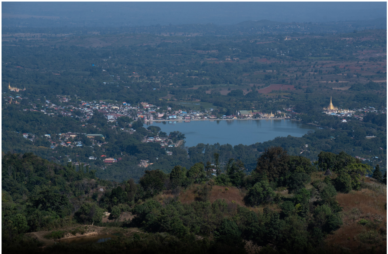
ပင်းတယမြို့ရှုခင်း၊ ပင်းတယမြို့နယ်၊ ဒီဇင်ဘာလ ၂၀၁၉

“အမျိုးသမီးတွေက အခြားအမျိုးသမီးကို ခွဲခြားဆန့်ကျင်ကြတယ်။ သူတို့က “ဒါက အမျိုးသားအလုပ်” လို့ပြောတယ်။ ကျေးရွာ အစည်းအဝေးတွေမှာ စကားထပြောတဲ့ အမျိုးသမီးကို အခြား အမျိုးသမီးတွေက အတင်းပြောကြတယ်။ “ဒီ မိန်းမ တော်တော်စွာတာပဲ” လို့ ပြောကြတယ်။ အစည်းအဝေး ပြီးသွားရင်တောင်မှ အဲဒီအစည်းအဝေးမှာ ထင်မြင်ချက်ပေးပြီး စကားထပြောတဲ့ အမျိုးသမီးကို ဆက်ပြီး ဝေဖန်တယ်၊ အတင်းပြောတယ်။ ဆိုတော့ အမျိုးသမီးတွေက အစည်းအဝေးတွေမှာ တစ်ခါလောက်ပဲ ပြောပြီး နောက်မပြောတော့ဘူး။”