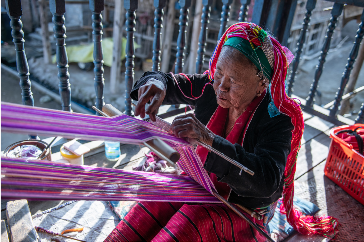
ဝမ်ပေါက်ကျေးရွာမှ ရက်ကန်းရက်လုပ်နေသော အမျိုးသမီး၊ ကျိုင်းတုံမြို့နယ်၊ ဒီဇင်ဘာလ ၂၀၁၉

ဖြေဆိုသူများ၏ ပြောကြားချက်များအရ နှစ်ပေါင်းများစွာ ကျင့်သုံးခဲ့သည့် အချို့သော ယဉ်ကျေးမှုဆိုင်ရာ စံနှုန်းများ နှင့် ဓလေ့ထုံးတမ်းများသည် ရပ်ရွာအတွင်းရှိ ခွဲခြားဆက်ဆံသည့် ကျင့်သုံးမှုများကို အားကောင်းစေသည်။ ကျား မဆိုင်ရာ အခန်းကဏ္ဍနှင့် ပတ်သက်သော သဘောတရားများသည် အချို့သော ဖြစ်ရပ်များတွင် ပြောင်းလဲနေသည်။ အခြားသော အခင်းအကျင်းများတွင် တင်းကြပ်သော စည်းမျဉ်းစည်းကမ်းများ ရှိနေသည်။ အချို့သော ဖြစ်ရပ်များတွင် အမျိုးသားများသည် အမျိုးသမီးများ ရပ်ရေးရွာရေး ကိစ္စရပ်များတွင် ပါဝင်မှုကို အားမပေးသော ယဉ်ကျေးမှုဆိုင်ရာ စံနှုန်းများကို အားကောင်းစေပြီး အချို့ဖြစ်ရပ်များတွင်မူ အမျိုးသမီးများသည် အမျိုးသမီးများအချင်းချင်း ဆန့်ကျင်သော ခွဲခြားဆက်ဆံသည့် ကျင့်သုံးမှုများကို အားကောင်းစေသည်။ ခွဲခြားဆက်ဆံသည့် ကျင့်သုံးမှုများ မည်ကဲ့သို့ “အလုပ်လုပ်သည်” နှင့် “မည်သူက” ၎င်းတို့ကို အားကောင်းစေသည်ကို နားလည်ခြင်းသည် အမျိုးသမီးများ၏ စွမ်းဆောင်နိုင်ခြင်း နှင့် မစွမ်းဆောင်နိုင်ခြင်း တို့အပေါ် သက်ရောက်စေသော အဓိကအချက်များကို ဖော်ထုတ်ခြင်း၏ အဓိက လက္ခဏာ တစ်ခုဖြစ်သည်။ အချက်အလက်များအရ အမျိုးသားရော အမျိုးသမီးပါ ရှေးစဉ်ကတည်းက ကျင့်သုံးခဲ့သည့် အမျိုးသား ကြီးစိုးသည့်စံနှုန်းများ ကို ကျင့်သုံးနိုင်သည်။