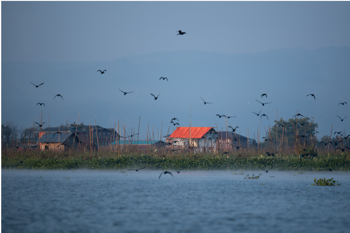
အင်းလေးကန်၊ ညောင်ရွှေမြို့နယ်၊ ဒီဇင်ဘာလ ၂၀၁၉

ထို့အပြင် စီးပွားရေး နှင့် နိုင်ငံရေး ကဏ္ဍများတွင် အမျိုးသမီးခေါင်းဆောင်မှုအတွက် အခွင့်အလမ်းများ ပိုမိုဖန်တီးရန် ကွဲပြားခြားနားသော မဟာဗျူဟာများ လိုအပ်သောကြောင့် မြို့ပြ နှင့် ကျေးလက်ဒေသ ရှိ အမျိုးသမီးများ၏ အတွေ့အကြုံများအကြား ခြားနားချက်ကို အသိအမှတ်ပြုရန် အရေးကြီးသည်။ နောက်ဆုံး ဖြစ်ရပ်လေ့လာမှုတွင် စီးပွားရေး ဖွံ့ဖြိုးတိုးတက်ရန် နှင့် အမျိုးသမီးများကို ခေါင်းဆောင်မှု ကဏ္ဍ ပေးအပ်ခြင်းအားဖြင့် ရပ်ရွာလူထု အသိုင်းအဝိုင်း၏ အသက်မွေးဝမ်းကျောင်းမှုများ မြှင့်တင်ခြင်း တွင် အမျိုးသမီးများ ကိုယ်တိုင် ပူးပေါင်းပါဝင် ဆောင်ရွက်ခြင်း၏ အရေးကြီးပုံကို မီးမောင်းထိုးပြ ထားသည်။ ထို့ကြောင့် အဓိက တွေ့ရှိချက်များက အမျိုးသမီးများသည် မြန်မာနိုင်ငံ၏ ရပ်ရွာအဆင့်၊ ပြည်နယ်အဆင့် နှင့် နိုင်ငံတော်အဆင့်တို့တွင် ရေရှည်တည်တံ့သော စီးပွားရေး ဖွံ့ဖြိုးတိုးတက်မှု ဖြစ်စဉ်၌ အဓိကကျသော အခန်းကဏ္ဍတွင်ပါဝင်သည်ဟု ဖော်ပြထားသည်။