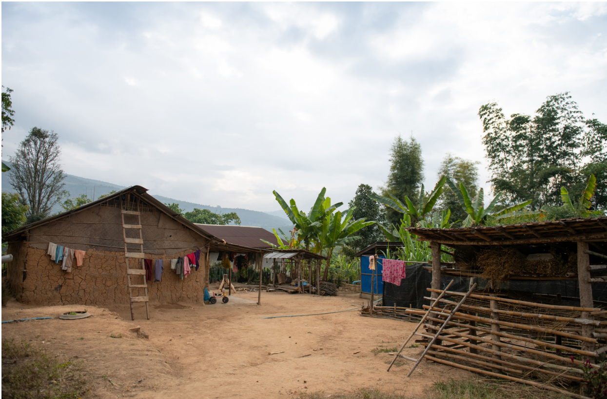
နာပါခါးကျေးရွာ၊ ကျိုင်းတုံမြို့နယ်၊ ဒီဇင်ဘာလ ၂၀၁၉

“ယောက်ျားတွေက မူးယစ်ဆေး ပြဿနာထဲမှာဘဲ နစ်နေကြပြီလေ၊ မိန်းမတွေ ကျွမ်းကျင်မှု၊ စွမ်းအားတွေမရှိရင် အနာဂတ်မှာခက်ခဲနိုင်တယ်။ (လားဟူလူမျိုးထဲကို ပြောတာပါ) မိန်းကလေးတွေက ယောက်ျားလေးတွေ သူကြီးလုပ်တာကို မိန်းကလေးတွေက ငါတို့လုပ်နိုင်တယ်လို့ ထပြောတာ မရှိဘူး၊ နောက်ကွယ်မှာတော့ အချင်းချင်း ပြောကြတယ်။ လူရှေ့တွေမှာ ထုတ်မပြောရဲဘူး။”