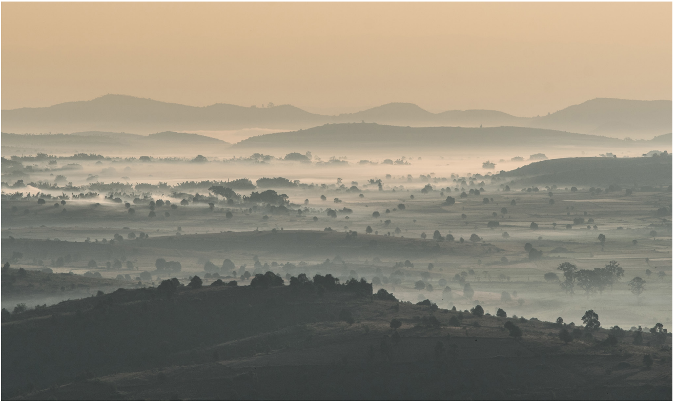
ကြေးတွင်းကုန်းကျေးရွာ ရှခင်း၊ ပင်းတယမြို့နယ်၊ ဒီဇင်ဘာလ ၂၀၁၉