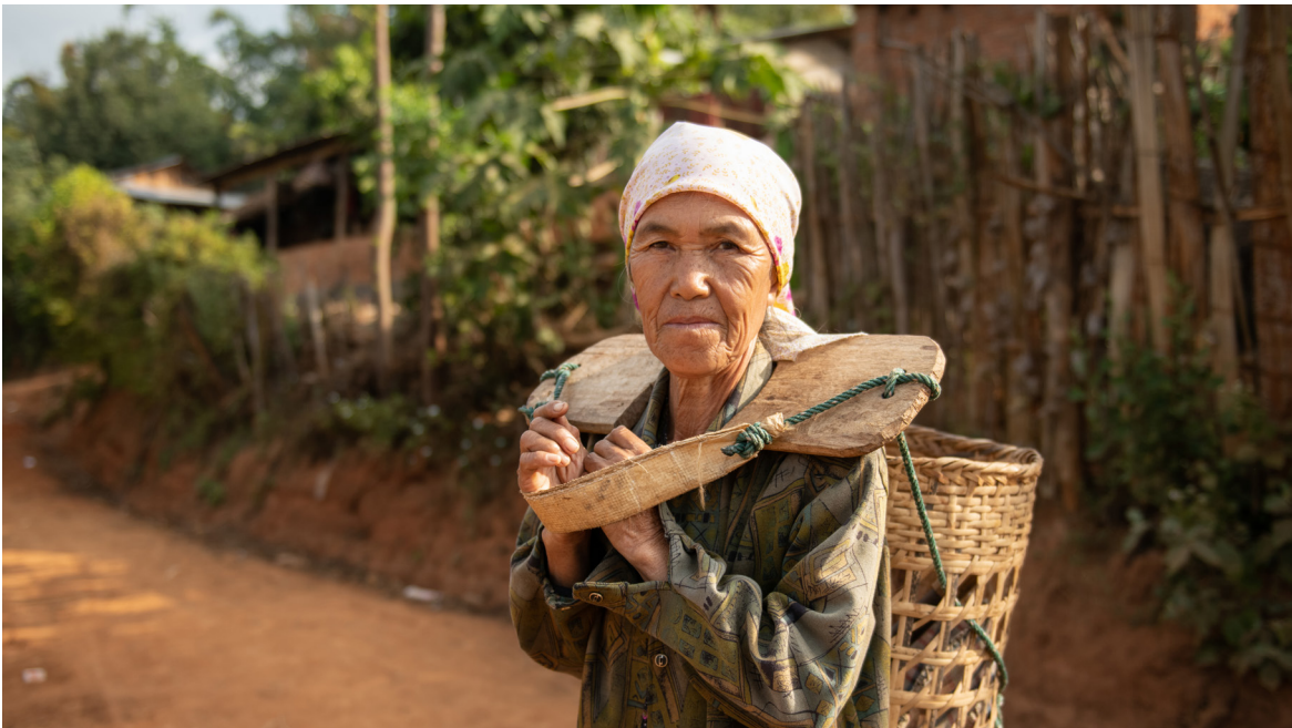
နောင်ရှဲန်ရွာမှ အာခါအမျိုးသမီးတစ်ဦး၊ ကျိုင်းတုံမြို့နယ်၊ ဒီဇင်ဘာလ ၂၀၁၉

ပအိုဝ်း ကိုယ်ပိုင်အုပ်ချုပ်ခွင့်ရ ဒေသအတွင်းမှ ပအိုဝ်း ထုံးတမ်းစဉ်လာ စည်းမျဉ်းစည်းကမ်းများတွင် အမျိုးသားများကို အဓိက ဆုံးဖြတ်ချက်ချသူများ ဖြစ်သည်ဟု ဖော်ပြထားသည်။ သို့သော်လည်း စီးပွားရေး နှင့် နိုင်ငံရေးဆိုင်ရာ ဆုံးဖြတ်ချက်များ ချမှတ်သည့် လုပ်ငန်းစဉ်တွင် အမျိုးသမီးများ ပါဝင်ရန်အတွက် အခွင့်အလမ်း များပိုမို ဖန်တီးထားသည်။ အဘယ်ကြောင့်ဆိုသော် ပအိုဝ်း အမျိုးသား အဖွဲ့ချုပ် (PNO) မှ အမျိုးသမီးများ၏ ပညာရေးကို ဦးစားပေးသောကြောင့် ဖြစ်သည်။