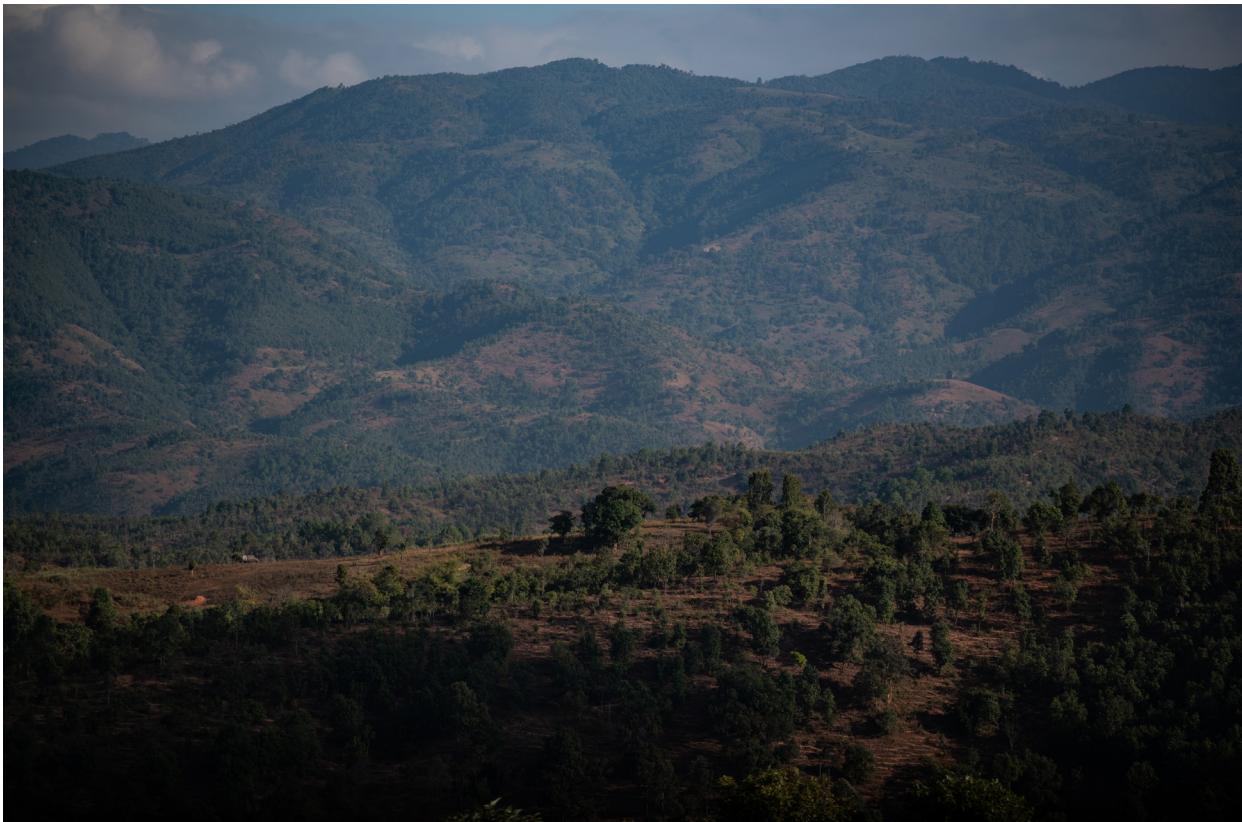
ပြည်သူ့အစုအဖွဲ့ပိုင်သစ်တော၊ ဝမ်တောင်းကျေးရွာ၊ ကျိုင်းတုံမြို့နယ်၊ ဒီဇင်ဘာလ ၂၀၁၉

“ဝန်ကြီးလာတော့ ရွာသားတွေက လယ်စိုက်တာရပ်ပြီး သောင်းသောင်းဖြဖြ ကြိုကြတာပေါ့။ ကြိုပြီးတော့မှ တစ်ခါတည်း ကျွန်မ ပြောတော့တာပဲ “ဝန်ကြီးရှင် စာရွက်ပေါ်မှာ လယ်မထွန်ပါနဲ့” ဆိုပြီး ပြောတော့ ရွာသားတွေက အောက်က လက်ခုပ်တွေတီးပြီး အားပေးကြတာဆိုတာ ဝန်ကြီးလည်း နည်းနည်းတော့ လန့်သွားတာပေါ့”