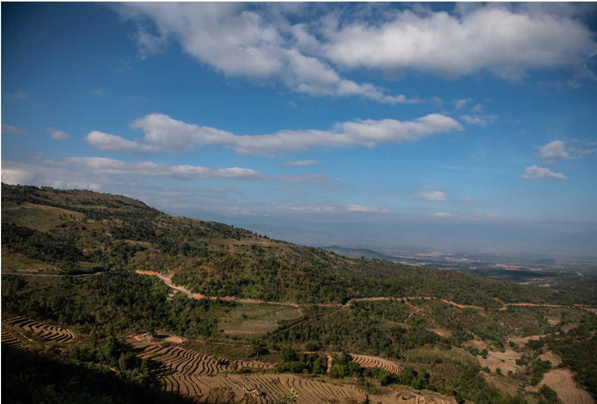
လွယ်မွေတောင်မှ ရှုခင်းသာ၊ ကျိုင်းတုံမြို့နယ်၊ ဒီဇင်ဘာလ ၂၀၁၉

ပြီးခဲ့သည့် အပိုင်းတွင် ဆွေးနွေးခဲ့သည့်အတိုင်း၊ အထက် ဖော်ပြပါ ဝန်ဆောင်မှုများအတွက် ပအိုဝ်းဒေသမှ ပြည်သူများသည် များသောအားဖြင့် ပအိုဝ်းအမျိုးသားအဖွဲ့ချုပ်ကို မှီခိုလေ့ ရှိသည်။ ပအိုဝ်းအသိုင်းအဝိုင်းအတွင်း၌ အမျိုးသမီးများ၏ နိုင်ငံရေးတွင် ပါဝင်မှုတွင် အပြုသဘောဆောင်သော တိုးတက်မှုအချို့ရှိသော်လည်း ပအိုဝ်းအမျိုးသားအဖွဲ့ချုပ်သည် ကျေးရွာအုပ်ချုပ်ရေးနှင့် အခြားဆုံးဖြတ်ချက်ချသည့် နေရာများတွင် အမျိုးသမီးများပါဝင်စေရန် မဟာဗျူဟာများ ချမှတ်ရန် ကြိုးစားနေဆဲဖြစ်သည်။