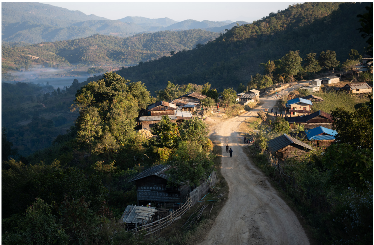
ယုတ်ကျေးရွာသို့ သွားသောလမ်း၊ ဟိုပုံးမြို့နယ်၊ ဒီဇင်ဘာလ ၂၀၁၉

“အမျိုးသမီး ဦးဆောင်ရင်တောင် အမျိုးသမီးတွေက မကြိုက်ဘူး ဘာဖြစ်လို့လည်းဆိုတော့ အချင်းချင်းဆို အထင်မကြီးကြတာလည်းပါတယ် အဲတာတွေကြောင့်လည်း အမျိုးသမီးဦးဆောင်ဖို့ အဟန့်အတား တစ်ခုလို့ ဖြစ်နေတာလည်းဟုတ်တယ်”