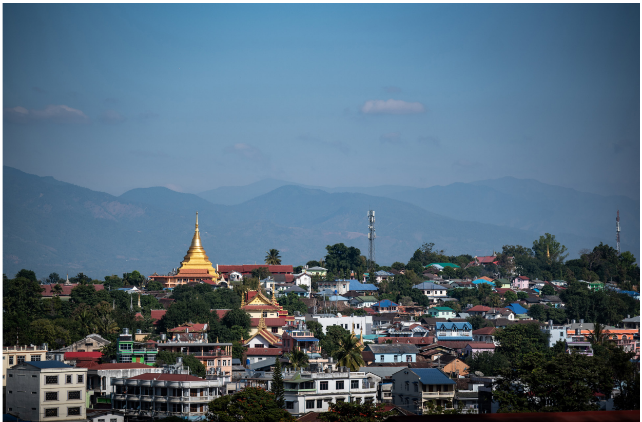
ကျိုင်းတုံမြို့၊ ဒီဇင်ဘာလ ၂၀၁၉

“ဘာကြောင့်လဲဆိုရင် အမျိုးသမီးမှာက အနုပညာ မျက်စိရှိတယ်။ ဦးဆောင် လုပ်ကိုင်နိုင်တဲ့ စွမ်းအားရှိကြတယ်။ ယောက်ျားက အနည်းငယ်သာ ပံ့ပိုးပေးတာပါ။ အားစိုက်ရတဲ့ စိုက်ပျိုးရေး အလုပ်မှာဆိုရင် အမျိုးသားတွေက လုပ်ကြတယ်ဆိုပေမယ့် ထွက်လာတဲ့ ကုန်ချောတွေကို အမျိုးသမီးက ဘယ်လိုလုပ်ရင် အမြတ်ရမလဲ ဆိုတာတွက်ပြီး အမျိုးသမီးက ဦးဆောင်တာတွေ့ရတယ်။”