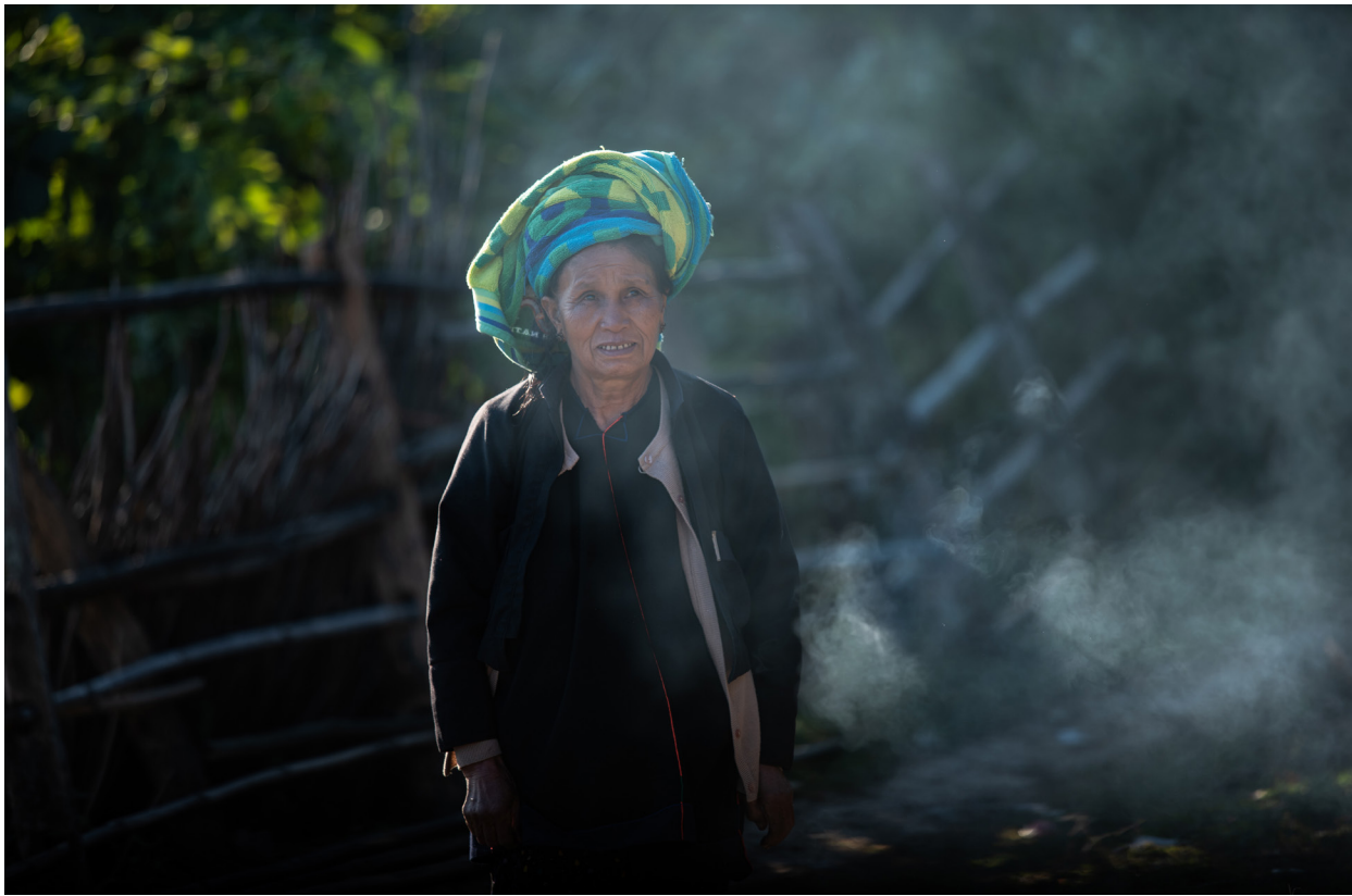
ယုတ်ကျေးရွာမှ ပအိုဝ်းအမျိုးသမီးကြီး၊ ဟိုပုံးမြို့နယ်၊ ဒီဇင်ဘာလ ၂၀၁၉