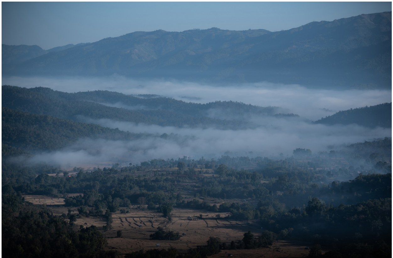
ယုတ်ကျေးရွာ၏ ရှုခင်း၊ ဟိုဝန်းမြို့နယ်၊ ဒီဇင်ဘာလ ၂၀၁၉

“ရိုးရာအရ ပိတ်ပင်ထားတာမဟုတ်ပေမဲ့လည်း အမျိုးသမီးရဲ့ စိတ်ထဲမှာ ဗီဇကိုက စိုးရိမ်နေသေးတယ်ပေါ့ ပွင့်လင်းလာတဲ့ ခုခေတ်မှာ အမျိုးသမီး အရေးလှုပ်ရှားမှုများစွာ ရှိတယ် ဆိုရင်တောင်မှ အမျိုးသမီးတွေ ပါဝင်ဖို့ မဝံ့မရဲဖြစ်နေတဲ့ အခြေအနေတွေလည်းရှိတယ် ဒါကြောင့် ဒီလိုမျိုး ကိစ္စတွေကို ပညာပေးလုပ်ဖို့လိုတယ် အမျိုးသားကော အမျိုးသမီးကိုပါ ပူးတွဲပြီး အမြင်ဖွင့်ပေးဖို့ အများကြီး လိုသေးတယ်”