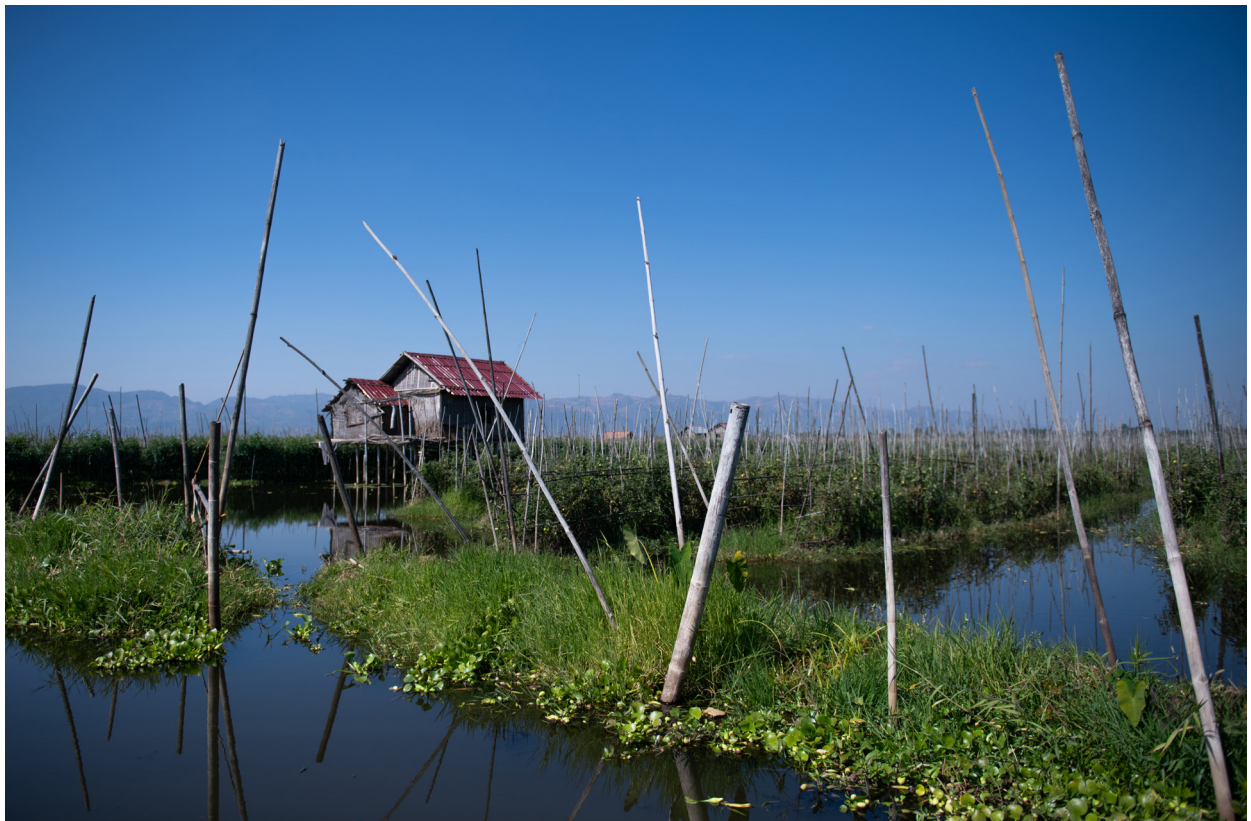
သပြေပင်ကျေးရွာ၊ အင်းလေးကန်၊ ညောင်ရွှေမြို့နယ်၊ ဒီဇင်ဘာလ ၂၀၁၉

“အမျိုးသမီးများသည် ရွေးကောက်ပွဲ ကာလအတွင်း အခြားအမျိုးသမီးများကို ရွေးကောက်ပွဲ ကိုယ်စားလှယ်လောင်း အဖြစ် သို့မဟုတ် အမည်စာရင်းတင်သွင်းခြင်း မရှိကြပါ။ ထို့အပြင် အခြားသူများ၏ ထင်မြင်ချက်နှင့် ပတ်သက်၍လည်း စိုးရိမ်ခြင်းကြောင့် အမျိုးသမီး များသည် မိမိကိုယ်ကို အမည်စာရင်းတင်သွင်းခြင်းလည်း မရှိကြပါ။”