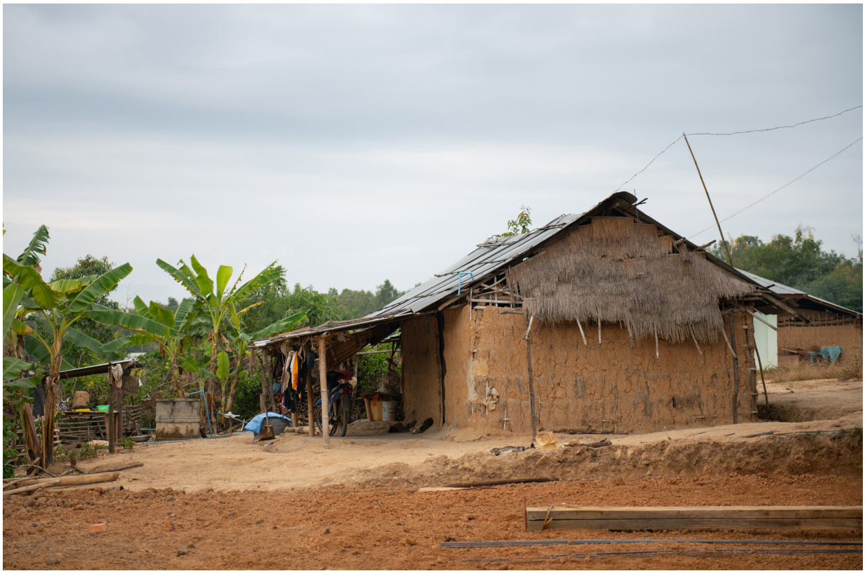
နာပါခါးကျေးရွာမှ ရွံ့အိမ်၊ ကျိုင်းတုံမြို့နယ်၊ ဒီဇင်ဘာလ ၂၀၁၉