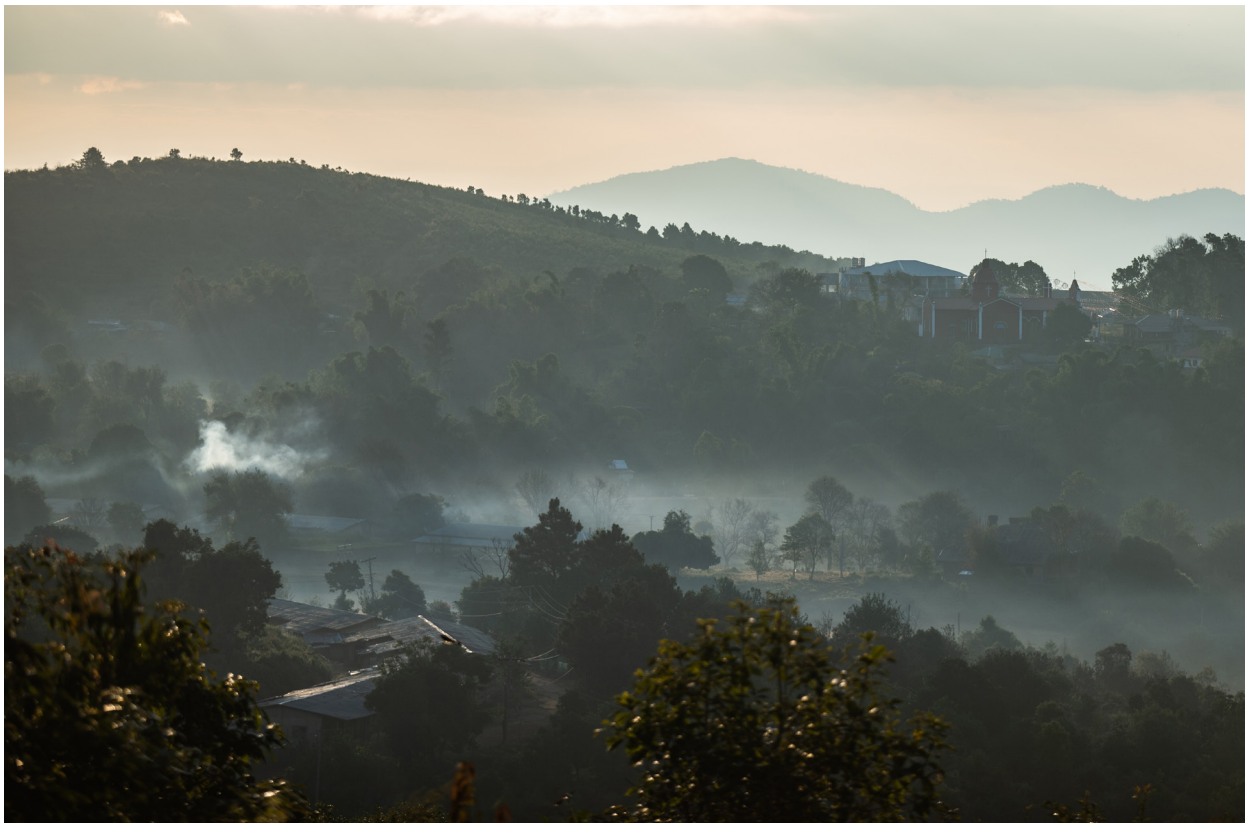
လွယ်မွေတောင်မှ ရှုခင်း၊ ကျိုင်းတုံမြို့နယ်၊ ဒီဇင်ဘာလ ၂၀၁၉