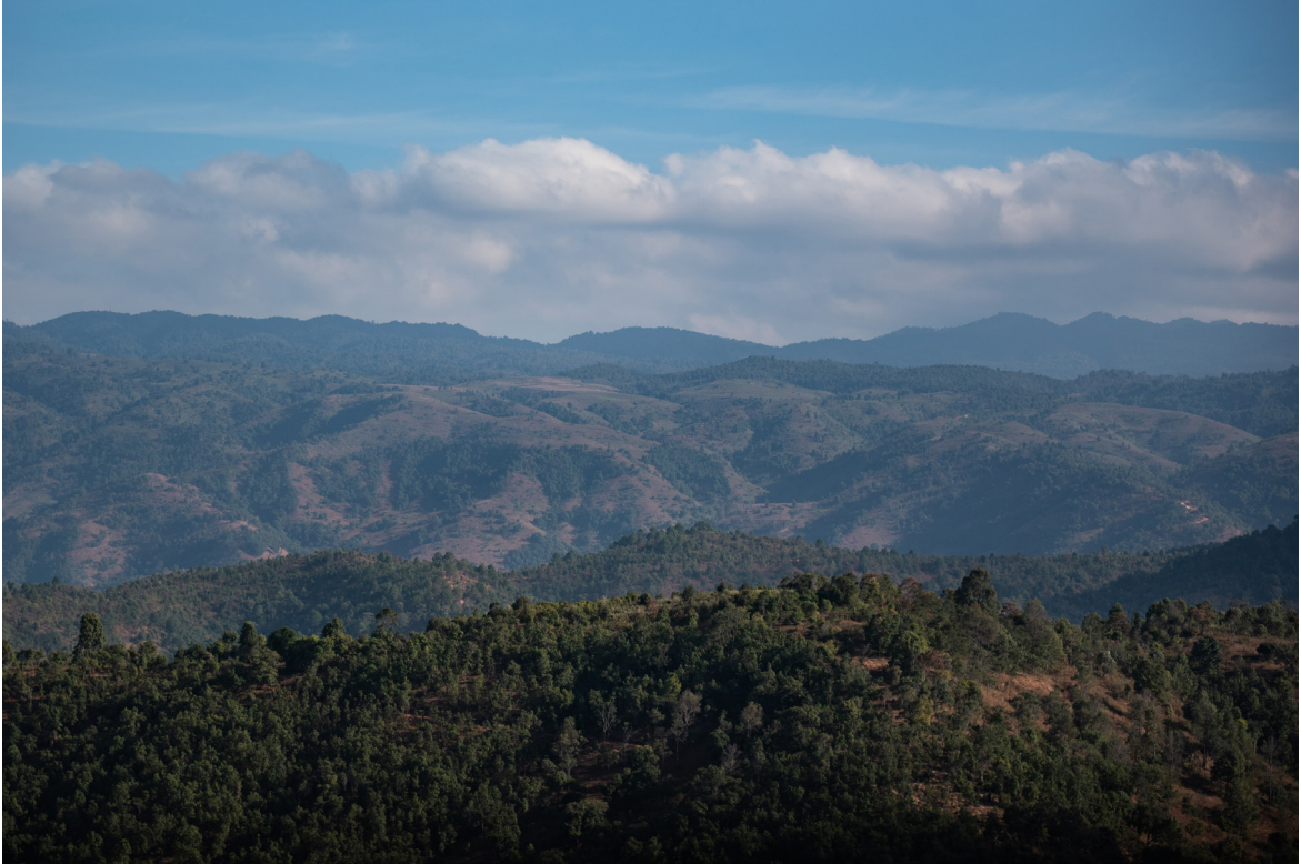
လွယ်မွေ အမျိုးသားသစ်တော၊ ကျိုင်းတုံမြို့နယ်၊ ရှမ်းပြည်နယ်အရှေ့ပိုင်း၊ ဒီဇင်ဘာလ ၂၀၁၉

အမျိုးသမီးများသည် ၎င်းတို့၏ အသိုင်းအဝိုင်းတွင် စီးပွားရေး နှင့် နိုင်ငံရေးများတွင် အပြည့်အဝ ပါဝင်ရန် စိန်ခေါ်မှုများနှင့် ရင်ဆိုင်ရသည့် အချိန်တွင် ကျော်လွှားရန်အတွက် ဆန်းသစ်သော နည်းဗျူဟာများ ရှိသည်။ ဤမဟာဗျူဟာများတွင် အမျိုးသမီး အဖွဲ့များဖွဲ့ခြင်း၊ အခြားသော အစိုးရမဟုတ်သည့် အဖွဲ့အစည်းများ/အရပ်ဘက် လူ့အဖွဲ့အစည်းများ နှင့် ပူးပေါင်းဆောင်ရွက်ခြင်း နှင့် ရပ်ရေးရွာရေး ကိစ္စရပ်များတွင် အမျိုးသမီးများ တက်ကြွစွာ ပါဝင်မှုကို လက်ခံသော ကျေးရွာ အုပ်ချုပ်ရေး အရာရှိများနှင့် ဆက်သွယ်ပြောဆို ဆောင်ရွက်ခြင်း စသည်တို့ ပါဝင်သည်။ အောက်ပါ ဖြစ်ရပ်လေ့လာမှုများတွင် ဖော်ပြထားသည့်အတိုင်း ရှမ်း နှင့် အင်းသား အသိုင်းအဝိုင်းမှ အမျိုးသမီး အဖွဲ့များသည် တိကျသော အခန်းကဏ္ဍတွင်ပါဝင်ဆောင်ရွက်သည်။ အထူးသဖြင့်အမျိုးသမီးအဖွဲ့များသည်လူမှုရေးအဖွဲ့အစည်းများ အဖြစ် တာဝန်ထမ်းဆောင်ကြသည်။ ၎င်းအဖွဲ့များသည် အမျိုးသမီးများကို ထောက်ပံ့မှုပေးသော်လည်း ပဋိပက္ခများ ပေါ်ပေါက်လာသည့်အခါ ဖျန်ဖြေသည့် ကဏ္ဍမှလည်း ပါဝင်နိုင်သည်။