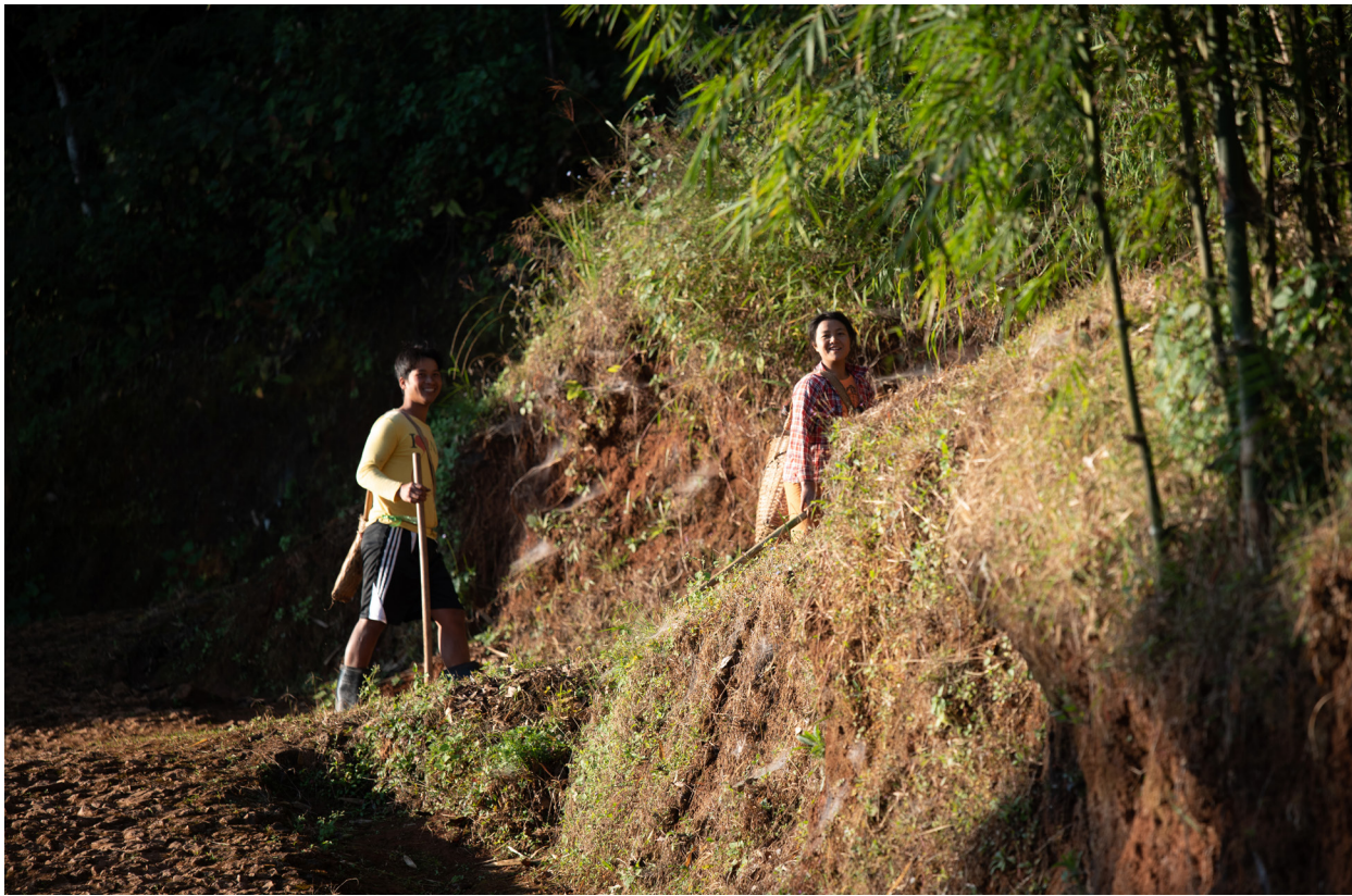
ကြေးတွင်းကုန်းရွာမှ တောင်ခါးပန်း၊ ပင်းတယမြို့နယ်၊ ဒီဇင်ဘာလ ၂၀၁၉