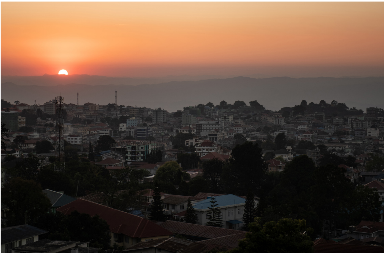
တောင်ကြီးမြို့ ရှုခင်း၊ ဒီဇင်ဘာလ ၂၀၁၉