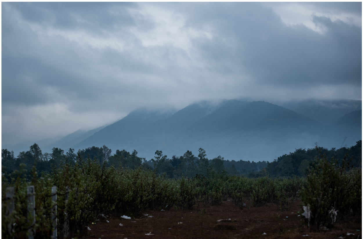
နာပါခါးကျေးရွာ အပြင်ဘက်၊ ကျိုင်းတုံမြို့နယ်၊ ဒီဇင်ဘာလ ၂၀၁၉

“ပြဿနာ တော်တော်များများကို ကျွန်မကဘဲ ဖြေရှင်းပေးခဲ့တယ်။ ရွာသားတွေက မိန်းမဖြစ်လို့ဆိုပြီး ဆန့်ကျင်တာတွေ မရှိပါဘူး။ ကျွန်မကို စကားပြောရင် သြဇာရှိတယ်။ သူများ လုပ်ချင်အောင် ပြောတတ်တယ် ဦးဆောင်တတ်တယ်ဆိုပြီး ပြောကြတယ်။ ဟုတ်မဟုတ်တွေ ကိုယ့်ဟာကိုယ် သိပ်မသိဘူး။ လက်ထောက် သူကြီး လုပ်ရင်းနဲ့ ရွာသားတွေကို ဦးဆောင်ပြီး လုပ်ရတာပျော်လာတယ်။”