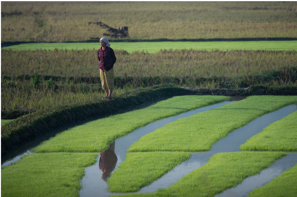
ဝမ်ပေါက်ကျေးရွာသို့ သွားသောလမ်းမှ စပါးပျိုးခင်းများ၊ ကျိုင်းတုံမြို့နယ်၊ ဒီဇင်ဘာလ ၂၀၁၉