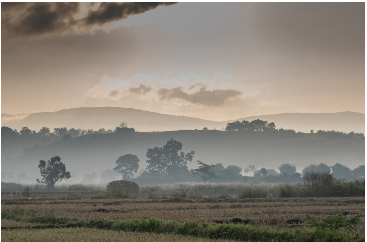
ကျိုင်းတုံမြို့နယ်မှ နောင်ရှန်ကျေးရွာသို့ သွားသောလမ်း၊ ဒီဇင်ဘာလ ၂၀၁၉