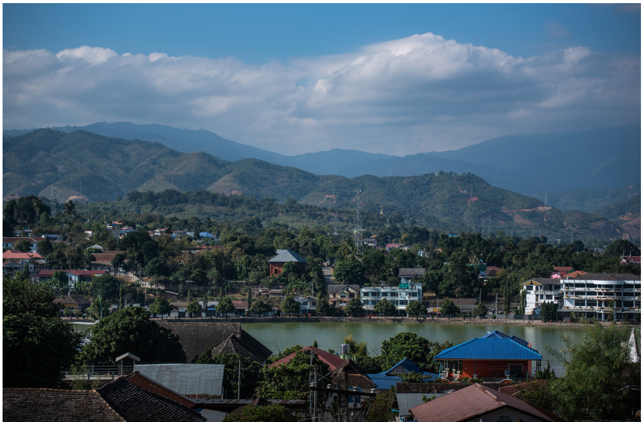
နောင်တုံကန်၊ ကျိုင်းတုံမြို့နယ်၊ ဒီဇင်ဘာလ ၂၀၁၉

“ကျားမ တန်းတူညီမျှရေးလို့ ဘယ်လောက်ပဲ ပြောပြော တန်းတူ မဖြစ်သေးပါ။ ဒါကိုရဖို့ ကျွန်မတို့ ကြိုးစားနေတုန်းဘဲ ရှိနေသေးတယ်။ တိုင်းရင်းသားဆိုရင်လဲ အမျိုးသားကဘဲ ဦးဆောင်တယ်။ ဆုံးဖြတ်ချက်လဲသူတို့ (အမျိုးသား)ဘဲ လုပ်တယ်။ အမျိုးသားက အိမ်ထောင်ဦးစီးလုပ်တယ်။ အမျိုးသမီးက နောက်ကလိုက်ရတယ်။ စားဝတ်နေရေးအတွက် တချို့အိမ်တွေမှာ အမျိုးသမီးပဲ ဦးဆောင်တာ တွေ့ရပေမဲ့ အသိအမှတ် ပြုခြင်းမခံရဘူး။”