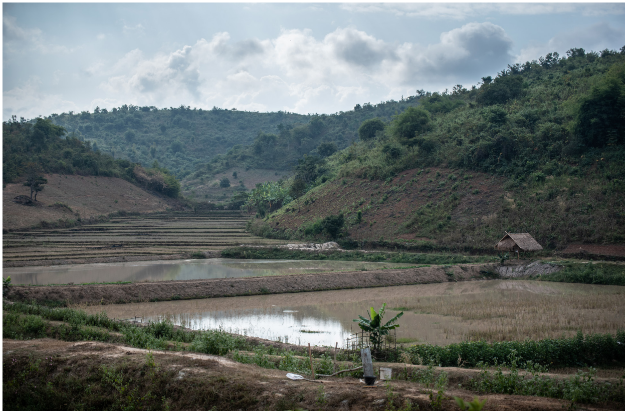
နောင်ရှဲ့န်ကျေးရွာ၊ ကျိုင်းတုံမြို့နယ်၊ ဒီဇင်ဘာလ ၂၀၁၉

“အဓိက ပြဿနာက အမျိုးသားတွေပဲ အမျိုးသမီးတွေမဟုတ်ဘူး။ အမျိုးသမီးတွေ သင်တန်းလာတက်ဖို့ ကျွန်မ လွယ်လွယ်ကူကူ စည်းရုံးလို့ရတယ်။ တကယ်တော့ ကျွန်မ တို့ အမျိုးသားတွေရဲ့ သဘောထား (အမြင်) ကို အရင်ဆုံးပြောင်းဖို့လိုတယ်။ အကယ်၍ အမျိုးသားတွေရဲ့ သဘောထား မပြောင်းလဲဘူးဆိုရင် အမျိုးသမီးတွေက သင်တန်းလာကို ခဏပဲလာပြီး ရေရှည်တော့ ပြောင်းလဲမှာမဟုတ်ဘူး။ ဒါကြောင့် အမျိုးသားတွေရဲ့ သဘောထား ပြောင်းမှကိုရမယ်”