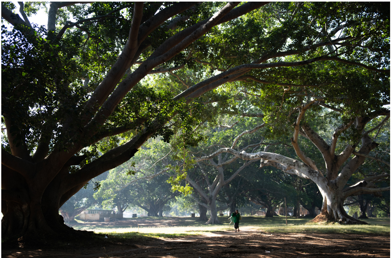
ပင်းတယတောင်ခြေမှ ရှုခင်း၊ ပင်းတယမြို့နယ်၊ ဒီဇင်ဘာလ ၂၀၁၉