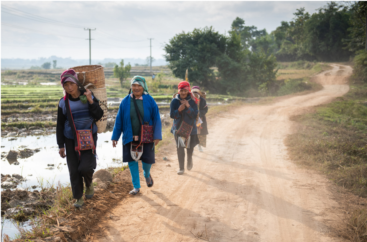
တင်ထပ်ရွာသို့ လမ်းလျှောက်နေကြသော တိုင်းရင်းသားများ၊ ကျိုင်းတုံမြို့နယ်၊ ဒီဇင်ဘာလ ၂၀၁၉

“တစ်နေ့ကျရင် ဘုန်းဘုန်းတို့ လည်းသေကြမှာပဲ အဲဒါကြောင့် ကိုယ်သေသွားခဲ့သော် နောက်ကျန်ခဲ့တဲ့ မျိုးဆက်သစ်တွေက ဒီအသိုင်းအဝိုင်း ပတ်ဝန်းကျင်ကို ပြောင်းလဲနိုင်လိမ့်မယ်လို့ ဘုန်းဘုန်း မျှော်လင့်တယ်။ ဒါကြောင့်မို့လို့ အနာဂတ်အတွက် ပြင်ဆင်တဲ့ အနေနဲ့ ဘုန်းဘုန်း လူငယ်တွေကို လေ့ကျင့်ပေးနေတာ အထူးသဖြင့်တော့ အမျိုးသမီးငယ်လေး တွေကိုပေါ့”