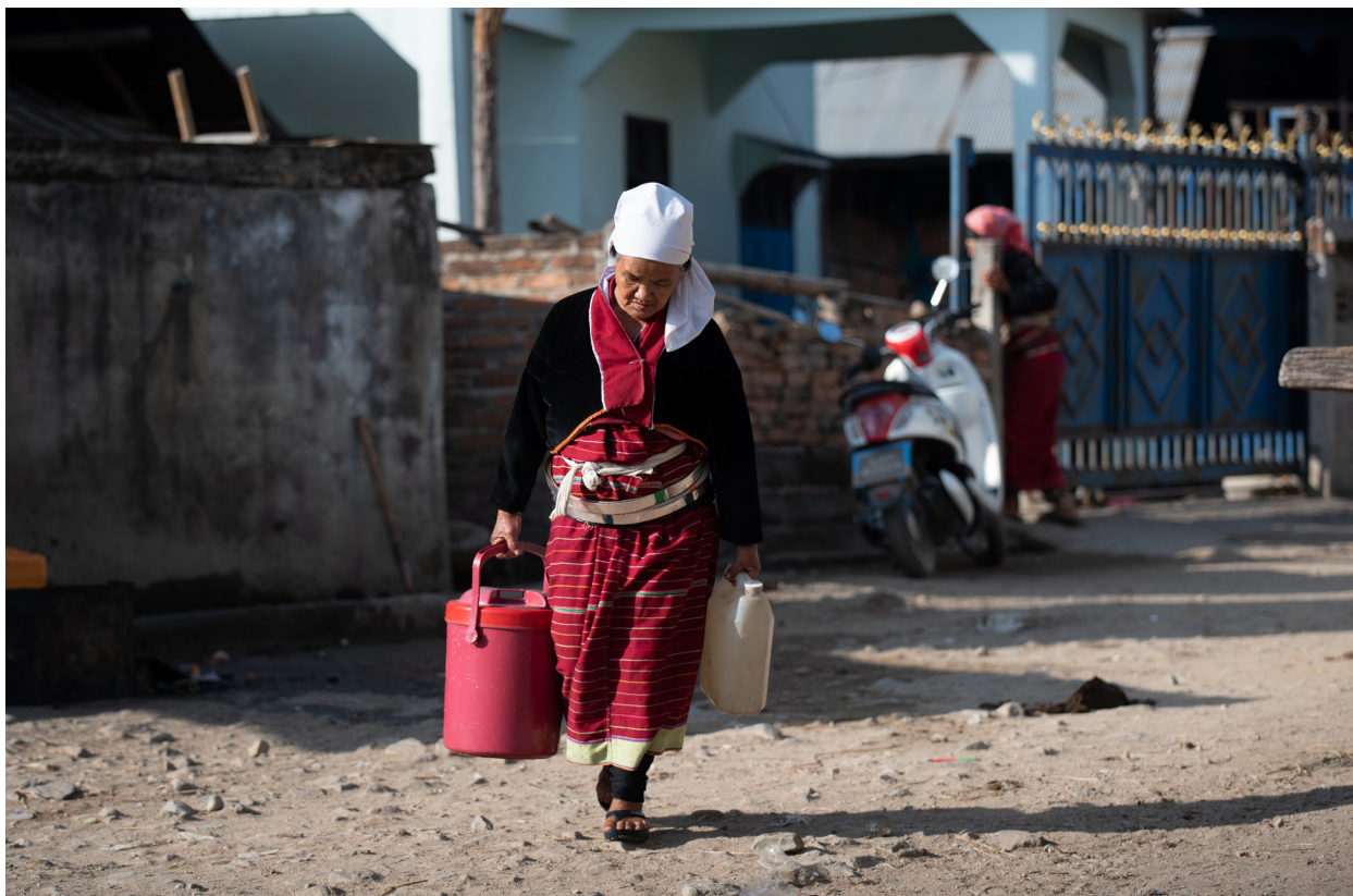
ဝမ်ပေါက်ကျေးရွာမှ ရေသယ်နေသော အမျိုးသမီး၊ ကျိုင်းတုံမြို့နယ်၊ ဒီဇင်ဘာလ ၂၀၁၉

“ရွာတည်ကတည်းက အုပ်ချုပ်ရေးအပိုင်းမှာ မိန်းမတွေ မပါခဲ့တာ အခုအချိန်အထိပဲ။ မိန်းမတွေကလည်း မတောင်းဆိုခဲ့သလို ယောကျ်ားတွေကလည်း မိန်းမတွေကို ထည့်သွင်းပါဝင်ခွင့်ပေးဖို့ မစဉ်းစားခဲ့ဘူး။ အမျိုးသမီးတွေရဲ့ တာဝန်ဆိုပြီးတော့လည်း မသတ်မှတ်ခဲ့ဘူး။ ပလောင်ရိုးရာ ရိုးရာလေ့အရ အမျိုးသမီးများကို ပါဝင်ခွင့်မပေးဘူး။ ဖြစ်လဲမဖြစ်နိုင်ဘူး။”