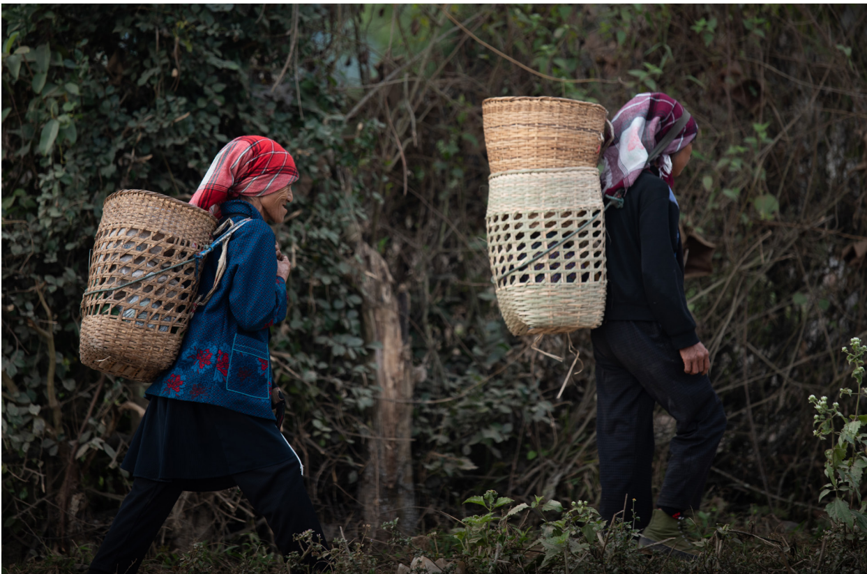
တင်ထပ်ကျေးရွာ၊ ကျိုင်းတုံမြို့နယ်၊ ဒီဇင်ဘာလ ၂၀၁၉