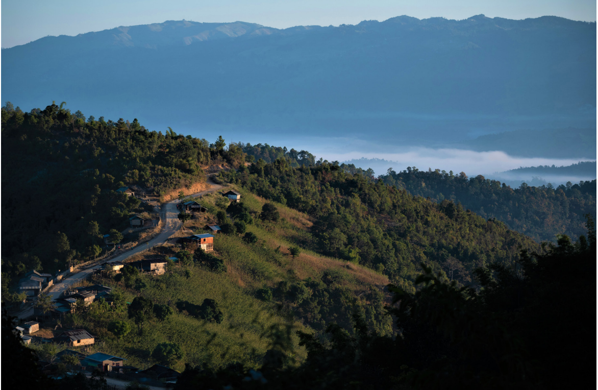
ယုတ်ကျေးရွာသို့ သွားသောလမ်း၊ ဟိုပုံးမြို့နယ်၊ ဒီဇင်ဘာလ ၂၀၁၉

အချို့သော အမျိုးသမီးများသည် ရပ်ရွာလူထုအတွင်း ပွင့်ပွင့်လင်းလင်းပြောဆိုပြီး ခေါင်းဆောင်မှု ကဏ္ဍကို တာဝန်ယူသည့် အခြား အမျိုးသမီးများကို ပွင့်လင်းစွာပင် ဝေဖန်ပြောဆိုကြသည်။ ထိုကဲ့သို့သော အမျိုးသမီးများသည် အခြားသော အမျိုးသမီးများ၏ အမှုအကျင့်များကို စောင့်ကြည့်လေ့လာနေကြသည်။ အကယ်၍ အခြားသော အမျိုးသမီးများ လူမှုရေး စံနှုန်းများကို မလိုက်နာပါက သူတို့ကို မကြာခဏ ပြင်းထန်စွာ ဝေဖန်သည်။ ထို့ကြောင့် အချက်အလက်များအရ အချို့သော အမျိုးသမီးများသည် အမျိုးသားကြီးစိုးသည့် စံနှုန်းများနှင့် ခွဲခြားဆက်ဆံသည့် ကျင့်သုံးမှုများကို ဆက်လက်ထိန်းသိမ်းထားသည်။