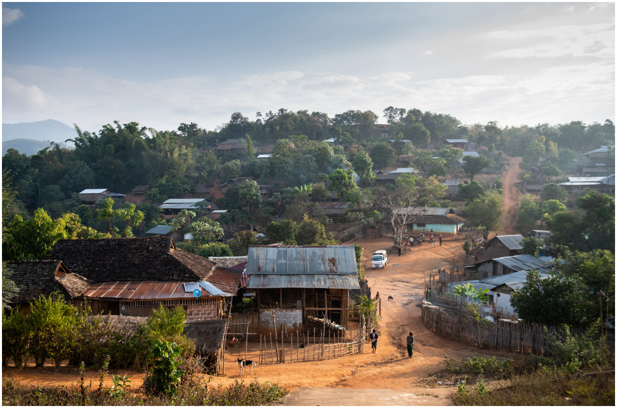
နောင်ရဲန်ကျေးရွာ ရွာလယ်ရှုခင်း၊ ကျိုင်းတုံမြို့နယ်၊ ဒီဇင်ဘာလ ၂၀၁၉