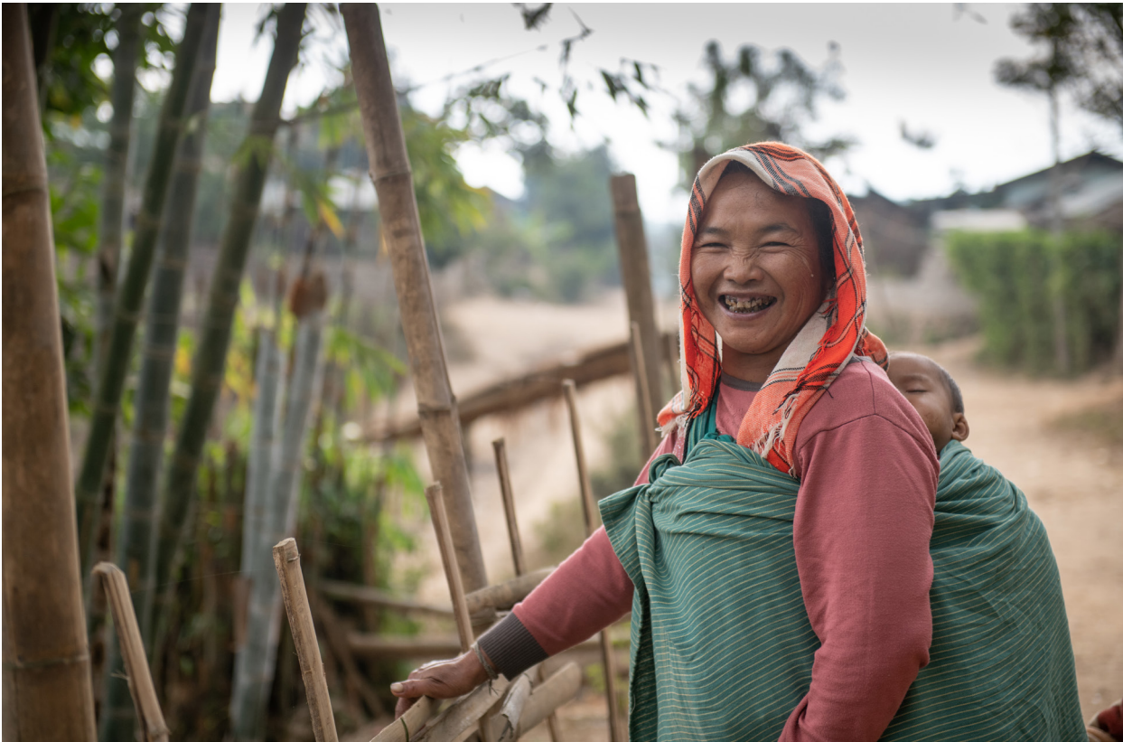
တင်ထပ်ကျေးရွာ၊ ကျိုင်းတုံမြို့နယ်၊ ဒီဇင်ဘာလ ၂၀၁၉