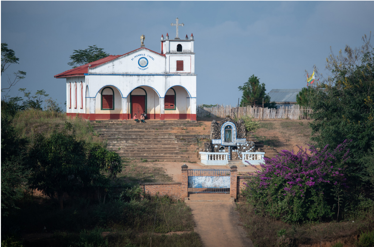
နောင်ရှန်ကျေးရွာမှ ဘုရားကျောင်း၊ ကျိုင်းတုံမြို့နယ်၊ ဒီဇင်ဘာလ ၂၀၁၉

“အဖေ့ကိုကျေးဇူးတင်တယ်၊ အဖေ့ရဲ့အမြင်က ရှေးရိုးစွဲဆိုရင် ကျွန်မလည်း ဒီလိုဖြစ်လာမှာ မဟုတ်ဘူး။ ကျွန်မလုံးဝ မကြောက်တတ်တော့ဘဲ ပြောရဲဆိုရဲ လာခဲ့တာ။ ဘယ်သွားသွား တစ်ယောက်ထဲပဲ။ အဖေကလဲစိတ်ချတယ်။”