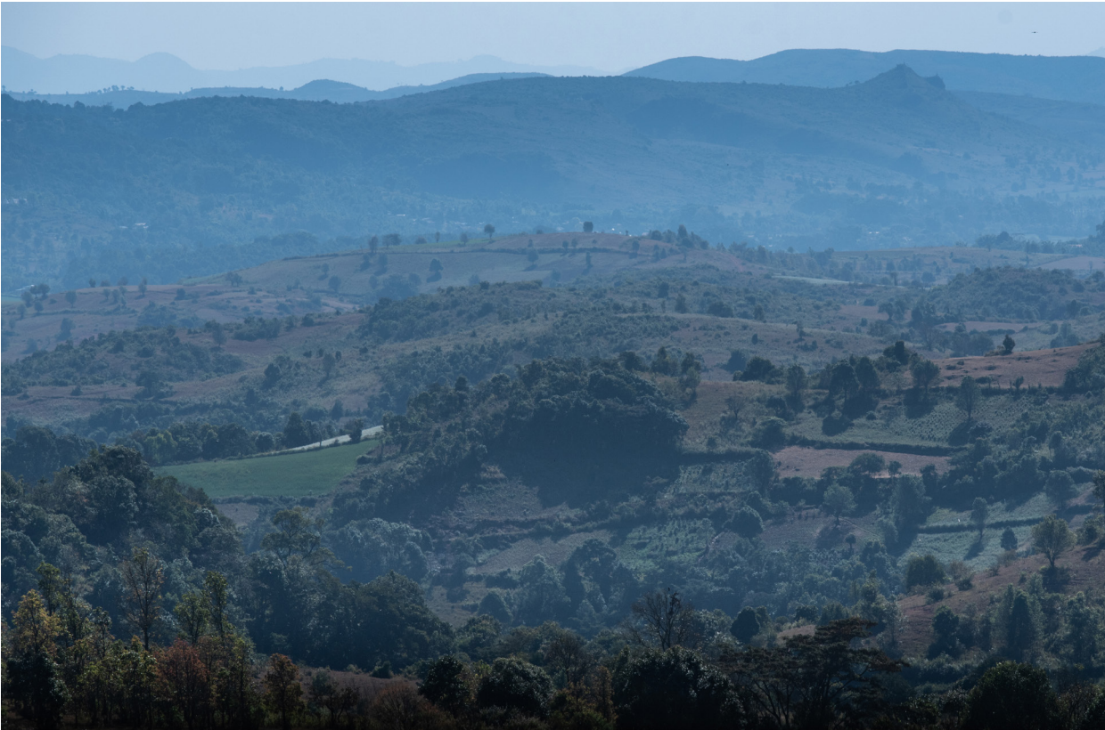
ကြေးတွင်းကုန်းကျေးရွာမှ လက်ဖက်ခင်းများ၏ ရှုခင်း၊ ပင်းတယမြို့နယ်၊ ဒီဇင်ဘာလ ၂၀၁၉

“အမျိုးသားတွေပဲ အုပ်ချုပ်မှုပိုင်းမှာ ရှိတယ်၊ အမျိုးသမီးတွေ မပါသေးဘူး။ ရှေးစဉ်ကတည်းက အမျိုးသားတွေကပဲ ရပ်ရွာသူကြီး၊ အုပ်ချုပ်ရေးမှူး လုပ်လာတော့ အမျိုးသမီးတွေက အုပ်ချုပ်ရေးပိုင်းဆိုရင် သူတို့နှင့် မသက်ဆိုင်သလို ဖြစ်နေတယ်။ အမျိုးသမီးတွေဆို ရွာကထွက်ပြီး အခြားတစ်နေရာကို သွားဖို့ ဟန့်တားတာတွေ ရှိခဲ့တယ်။ ရွေးကောက် တင်မြောက်ရင်လည်း အမျိုးသားတွေကပဲ ဝင်ရောက် ရွေးချယ် ခံယူကြတယ်။ အခုနောက်ပိုင်းတွေမှာ အုပ်ချုပ်မှုပိုင်းမှာ မပါပေမဲ့ အခြား ဒေသဖွံ့ဖြိုးရေးပိုင်း တွေမှာ အမျိုးသမီးတွေ နေရာယူလာကြတယ်၊ ဦးဆောင်လုပ်လာတယ်၊ ပါဝင်လာတယ်။”