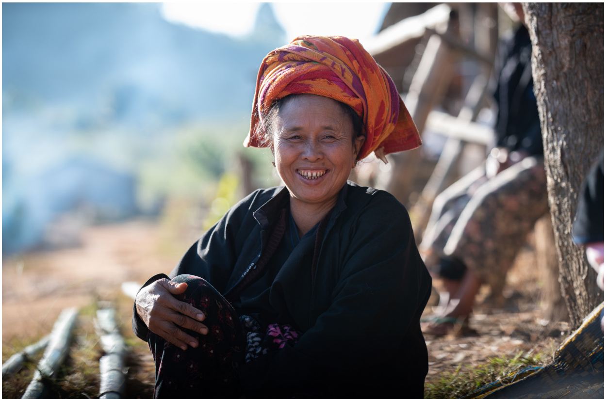
ယုတ်ကျေးရွာမှ ပအိုဝ်းအမျိုးသမီးတစ်ဦး၊ ဟိုပုံးမြို့နယ်၊ ဒီဇင်ဘာလ ၂၀၁၉