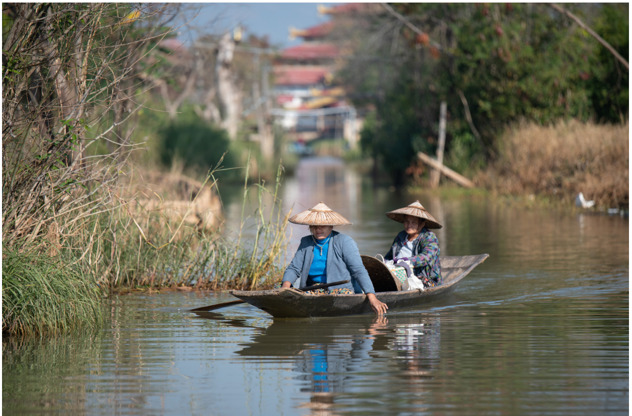
ဟဲယာရွာမကျေးရွာ၊ အင်းလေးကန်၊ ညောင်ရွှေမြို့နယ်၊ ဒီဇင်ဘာလ ၂၀၁၉