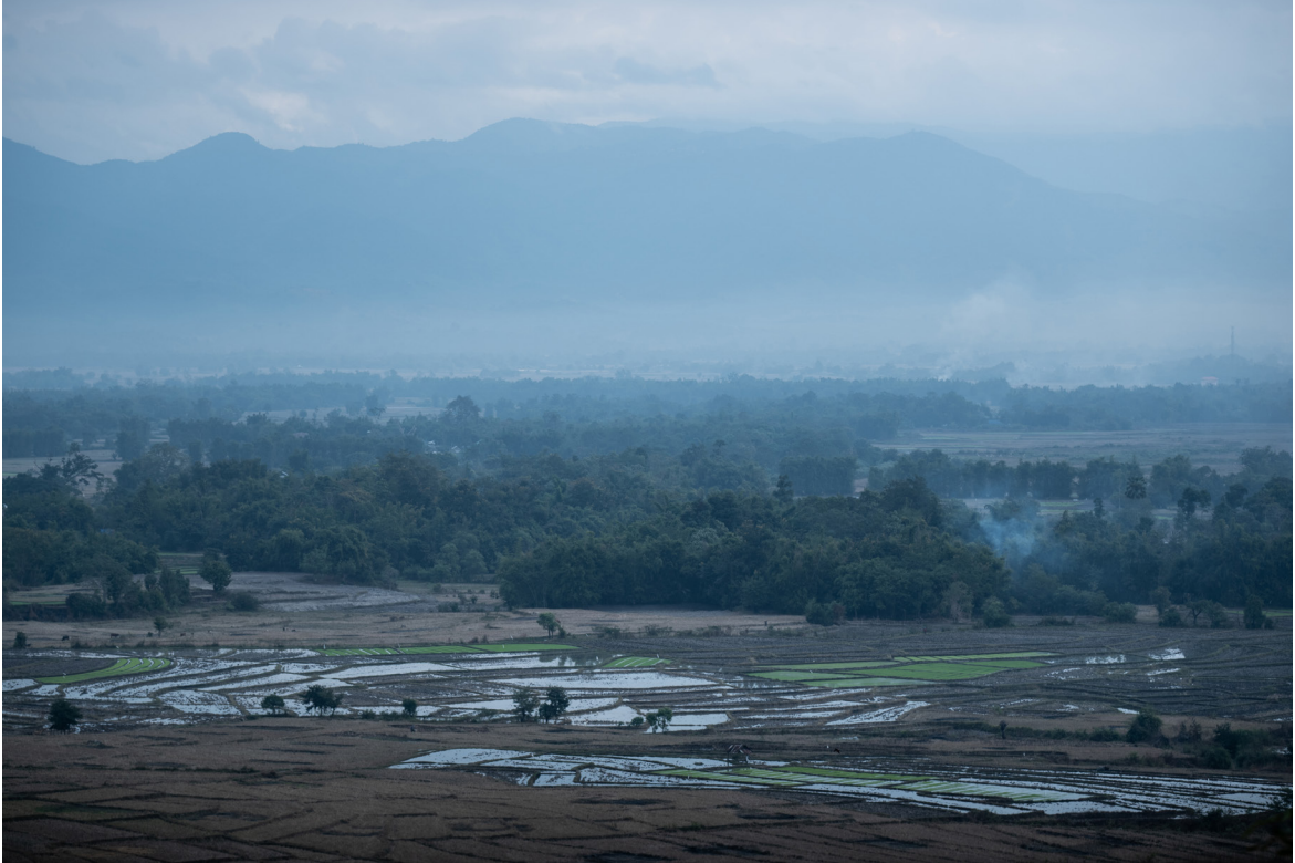
တင်ထပ်ကျေးရွာသို့သွားသောလမ်း၊ ကျိုင်းတုံမြို့နယ်၊ ဒီဇင်ဘာလ ၂၀၁၉

ကျားမရေးရာ တန်းတူညီမျှမှုကို ဦးစားပေးသော အမျိုးသားများသည် အမျိုးသမီးများ၏ လုပ်ပိုင်ခွင့် နှင့် ရေရှည်တည်တံ့သော ဖွံ့ဖြိုးတိုးတက်မှုတို့အကြား ဆက်နွယ်မှုကို တွေ့မြင်သောကြောင့် ရပ်ရေးရွာရေး ကိစ္စရပ်များ၌ အမျိုးသမီးများ ပါဝင်မှုကို အားပေးတိုက်တွန်းသည်။ အထူးသဖြင့် အချို့သော အခွင့်အာဏာရှိသည့် အမျိုးသားများသည် အမျိုးသမီးများ ဗဟုသုတ ချဲ့ထွင်နိုင်ရန် အလို့ငှာ စွမ်းဆောင်ရည်မြှင့် သင်တန်းများကို တက်ရောက်ရန် နှင့် ဦးဆောင်မှု အခန်းကဏ္ဍကို ရယူရန် အားပေးတိုက်တွန်းသည်။ အာခါ ရပ်ရွာအသိုင်းအဝိုင်း၏ အခြေအနေတွင် ၎င်းတို့၏ ရည်ရွယ်ချက်မှာ အမျိုးသမီးများ ၎င်းတို့၏ အခွင့်အရေးများကို သိရှိရန် စွမ်းရည်မြှင့်တင်ပေးခြင်းအားဖြင့် ကျား မ အခြေပြု အကြမ်းဖက်မှုများ လျော့ကျစေရန်လည်း ဖြစ်သည်။ ထို့နည်းတူစွာ လားဟူ ရပ်ရွာ အသိုင်းအဝိုင်းတွင်လည်း အချို့သော ဘာသာရေးခေါင်းဆောင်များသည် မူးယစ်ဆေးသုံးစွဲမှုကို ဖြေရှင်းရန် နှင့် လူကုန်ကူးမှု တိုက်ဖျက်ရန် အရပ်ဘက် လူမှုအဖွဲ့အစည်း များနှင့် ပူးပေါင်း လုပ်ကိုင်လျက်ရှိသည်။