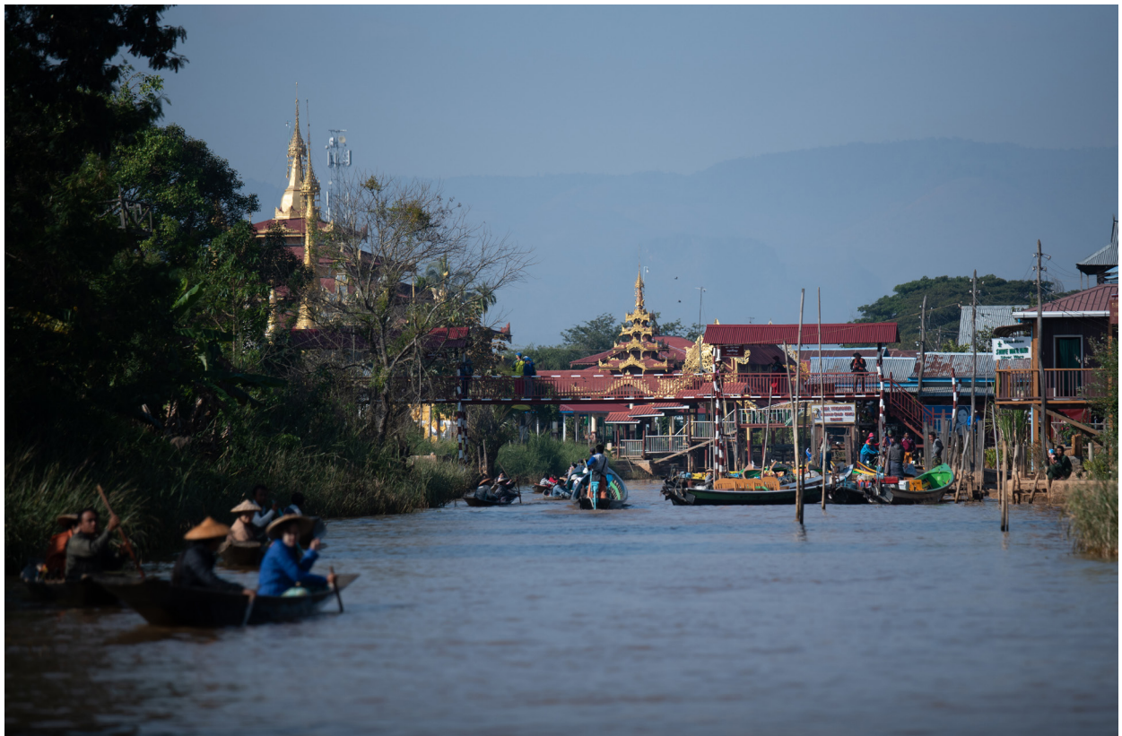
ဟဲယာရွာမ ကျေးရွာမှ တူးမြောင်း၊ အင်းလေးကန်၊ ညောင်ရွှေမြို့နယ်၊ ဒီဇင်ဘာလ ၂၀၁၉

“ကျွန်မကြုံတွေ့ရတဲ့ အခက်အခဲက အမျိုးသမီးတွေ သင်တန်းတက်ဖို့ ခေါ်ရတာပဲ။ သူတို့ မိသားစုတွေက သင်တန်းတက်တာ မကြိုက်ကြဘူး၊ ပြီးတော့ သူတို့တွေ သင်တန်းတွေတက်ပြီး ရွာရဲ့ ဖွံ့ဖြိုးရေး နဲ့ လူမှုရေး ကိစ္စတွေမှာ ပါဝင်တာကို လူတွေက ဝေဖန်ကြတယ်လေ၊ အဲဒါကို ခံနိုင်ရည်ရှိရမယ် ကျော်လွှားနိုင်ရမယ် မိသားစုဝင်လို့ ပြောတဲ့အခါမှာ အထူးသဖြင့်တော့ သူတို့ ယောက်ျားတွေက ပြဿနာပဲ။ တစ်ခါတစ်လေ သင်တန်းတက်နေတုန်း ယောက်ျားတွေက လာခေါ်သွားတာတွေ ရှိတယ်။”