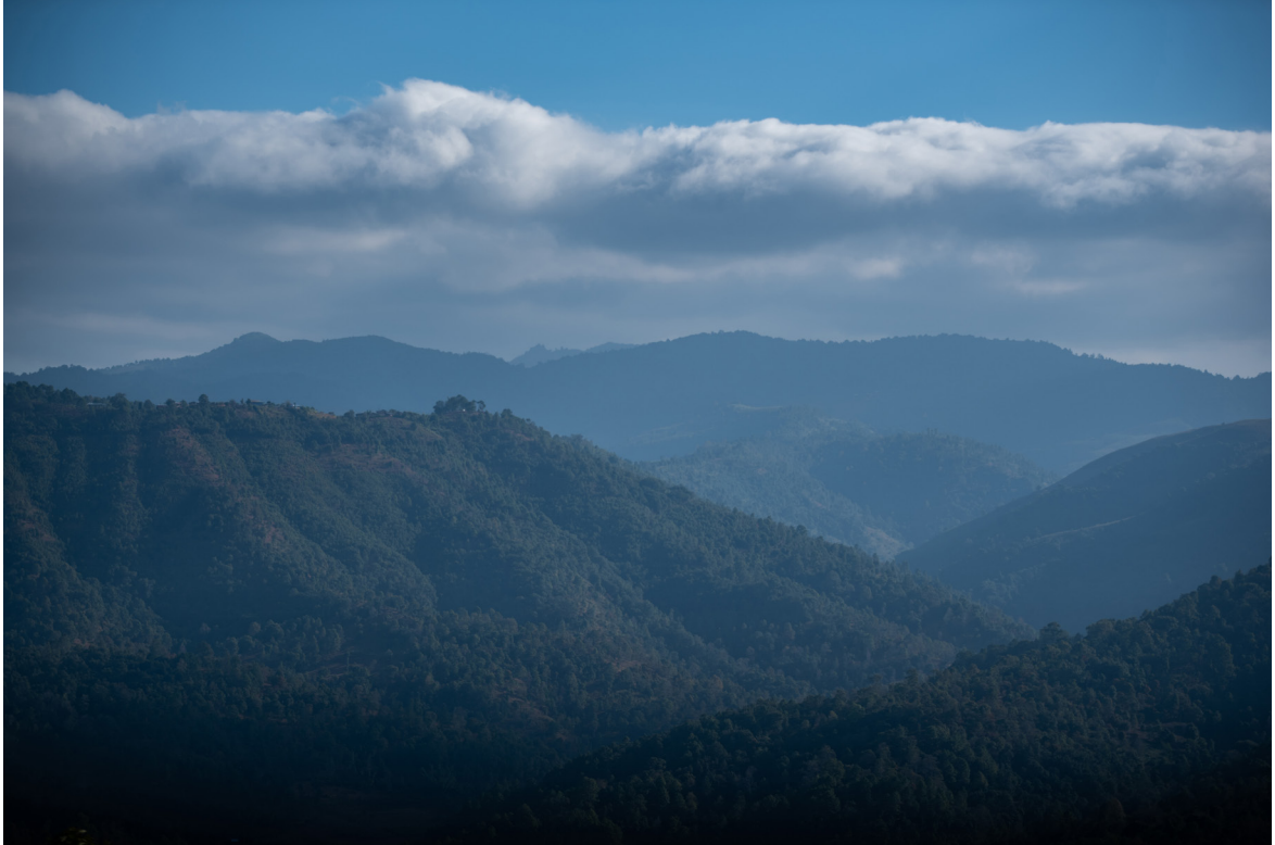
လွယ်မေ့ သဘာဝသစ်တော၊ ကျိုင်းတုံမြို့နယ်၊ ရှမ်းပြည်နယ်အရှေ့ပိုင်း၊ ဒီဇင်ဘာလ ၂၀၁၉

ကျိုင်းတုံမြို့နယ် ပတ်ဝန်းကျင်တွင် သဘာဝ သယံဇာတ အရင်းအမြစ်များ စီမံခန့်ခွဲမှု နှင့် ပတ်သက်၍ အမျိုးသမီးများအနေဖြင့် ဆုံးဖြတ်ခွင့် မရှိသလောက်ပင်ဖြစ်သည်။ ခြုံငုံပြောရမည်ဆိုလျှင် ကျေးရွာ ဖွံ့ဖြိုးတိုးတက်ရေး ကော်မတီတွင် အမျိုးသမီး ကိုယ်စားလှယ်များ မရှိခြင်းနှင့် ရပ်ရေးရွာရေး ကိစ္စရပ်များတွင် အမျိုးသမီးပါဝင်နှုန်း နည်းပါးသောကြောင့်ဖြစ်သည်။ အောက်တွင်ဖော်ပြထားသော ဖြစ်ရပ်လေ့လာမှုများမှ ရှမ်းပြည်နယ်ရှိ ကျေးရွာဖွံ့ဖြိုး တိုးတက်ရေး ကော်မတီများသည် အထွေထွေအုပ်ချုပ်ရေးဌာနမှ အသိအမှတ်ပြုထားသည်။ ကျိုင်းတုံမြို့တွင် လွယ်မေ့ အမျိုးသား သစ်တော နှင့် ကပ်လျက် အစုအဖွဲ့ပိုင်သစ်တော ရှိပြီး သစ်တော ဦးစီးဌာန လက်အောက်တွင် လုပ်ငန်းလည်ပတ်သော အစုအဖွဲ့ပိုင်သစ်တော အသုံးပြုသူ အုပ်စု ရှိသည်။ ရှမ်းပြည်နယ် အရှေ့ပိုင်းရှိ အထွေထွေအုပ်ချုပ်ရေးဌာန နှင့် သစ်တောဦးစီးဌာနမှ အရာရှိအများစုသည် အမျိုးသားများ ဖြစ်သည်။ သို့သော်လည်း အောက်တွင် ဖော်ပြထားသော ဖြစ်ရပ်တွင် သဘာဝ သယံဇာတဆိုင်ရာ အရင်းအမြစ်များ စီမံခန့်ခွဲမှု နှင့် သဘာဝပတ်ဝန်းကျင် ထိန်းသိမ်းစောင့်ရှောက်ရေးတွင် အမျိုးသမီးများ မည်ကဲ့သို့ တက်ကြွစွာ ပါဝင်နိုင်သည်ကို လေ့လာခြင်းအားဖြင့် တစ်ဦးခြင်းစီ နှင့် ရပ်ရွာလူထုအဆင့်တွင် အမျိုးသမီး အခွင့်အရေးများအတွက် လှုံ့ဆော်ထောက်ခံခြင်းဖြစ်သည်။