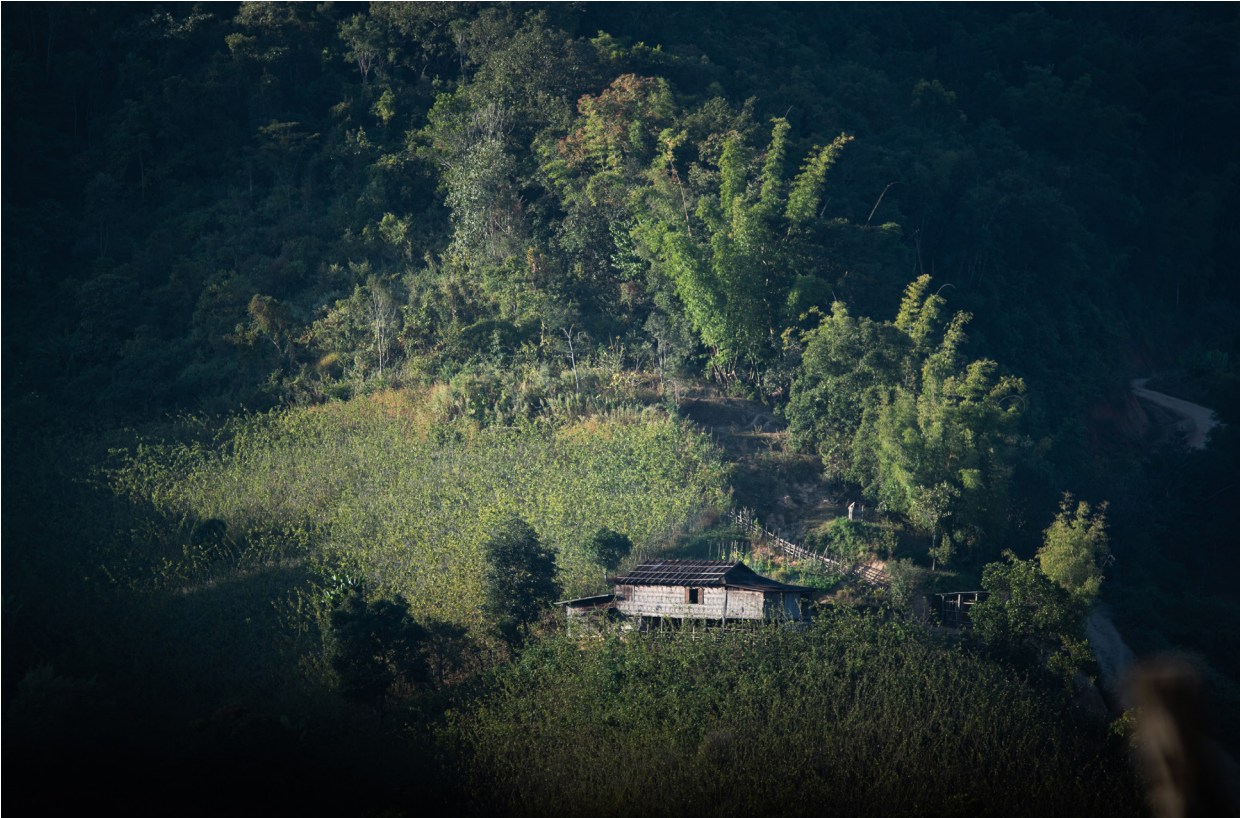
ယုတ်ကျေးရွာမှ ဝါးတောင်ခါးပန်း၊ ဟိုပုံးမြို့နယ်၊ ဒီဇင်ဘာလ ၂၀၁၉

“ကျွန်မတို့ ဘယ်လိုပဲ “အမျိုးသမီး စွမ်းဆောင်နိုင်စွမ်း” နဲ့ “ဦးဆောင်နိုင်တဲ့ အမျိုးသမီး” တို့ ပြောတဲ့အခါမှာ သူတို့က ပညာတတ်အမျိုးသမီးတွေကိုပဲ စဉ်းစားကြတယ်။ ဒါက အဆင့်သတ်မှတ်ချက် (ဘွဲ့ ဘယ်နှစ်ခုရတယ်ဆိုတာမျိုး) မဟုတ်ဘူး။ ကျွန်မတို့ ကျေးရွာမှာရှိတဲ့ အမျိုးသမီးတွေအတွက် ထည့်စဉ်းစားရမယ်။ ပညာတတ်တွေအတွက်ပဲ ရည်ရွယ်ထားတာမျိုး မဟုတ်ဘဲ သူတို့အတွက် သင်တန်းတွေ ဖန်တီးပေးရမယ်။ အခု လူ့အဖွဲ့အစည်းကို ဦးဆောင်နေတဲ့ အမျိုးသားတွေက ကျေးရွာမှာ အလုပ်လုပ်နေတဲ့ အမျိုးသမီးတွေ၊ ပညာ မတတ်တဲ့ အမျိုးသမီးတွေ အတွက်လည်း စဉ်းစားပေးရမယ်။ သူတို့လည်း လုပ်နိုင်စွမ်းရှိတယ်။”